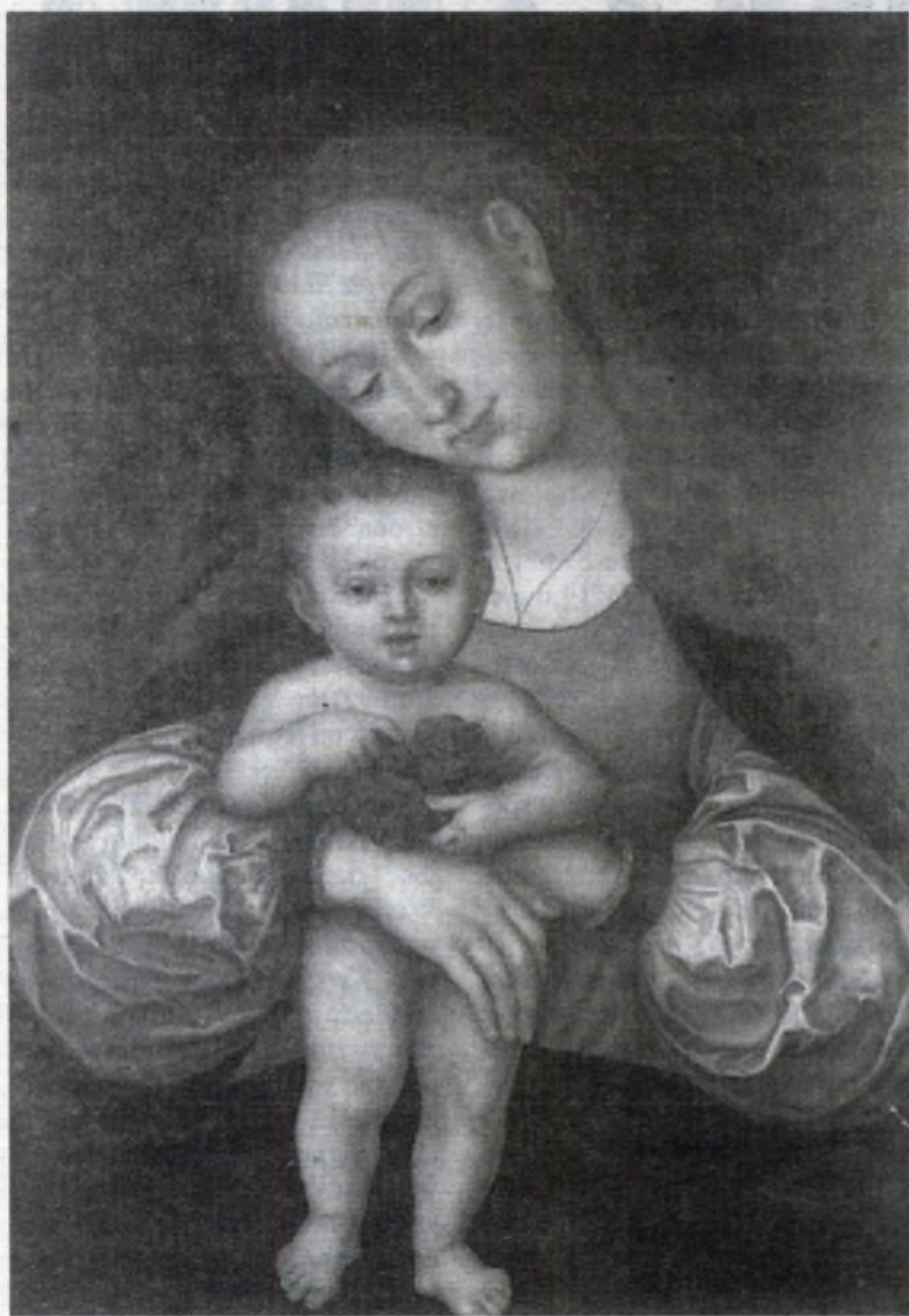
Lucas Cranach Młodszy (1515–1568) – „Maryja z Dzieciątkiem”