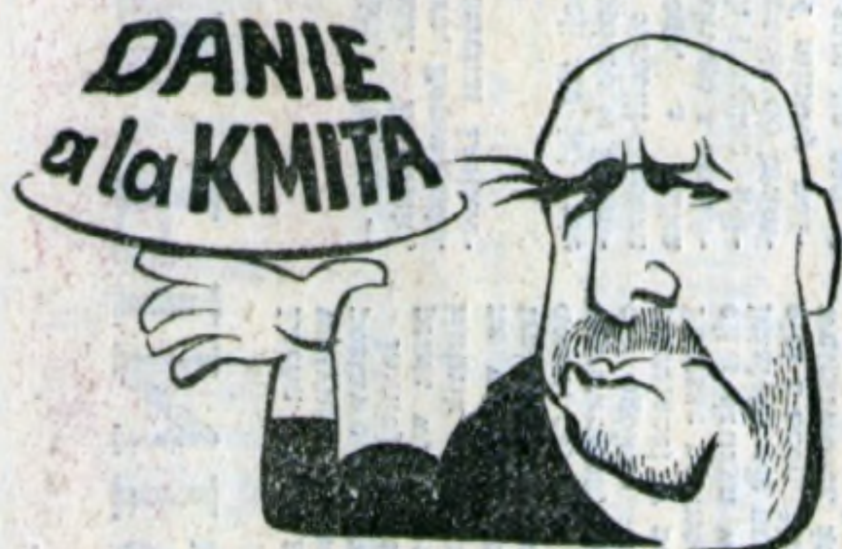
Krokiety z ryżu

KOMIS SAMOCHODÓW I KAROSERII PO WYPADKU pon. - piąt. 8 00 - 17 00 , sobota 8 00 - 13 00