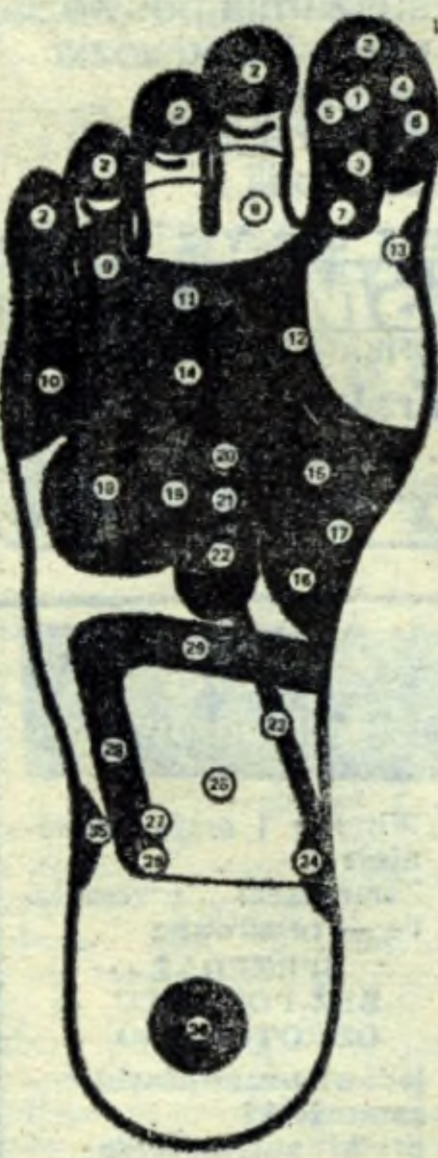
Legenda do rysunku prawej stopy: