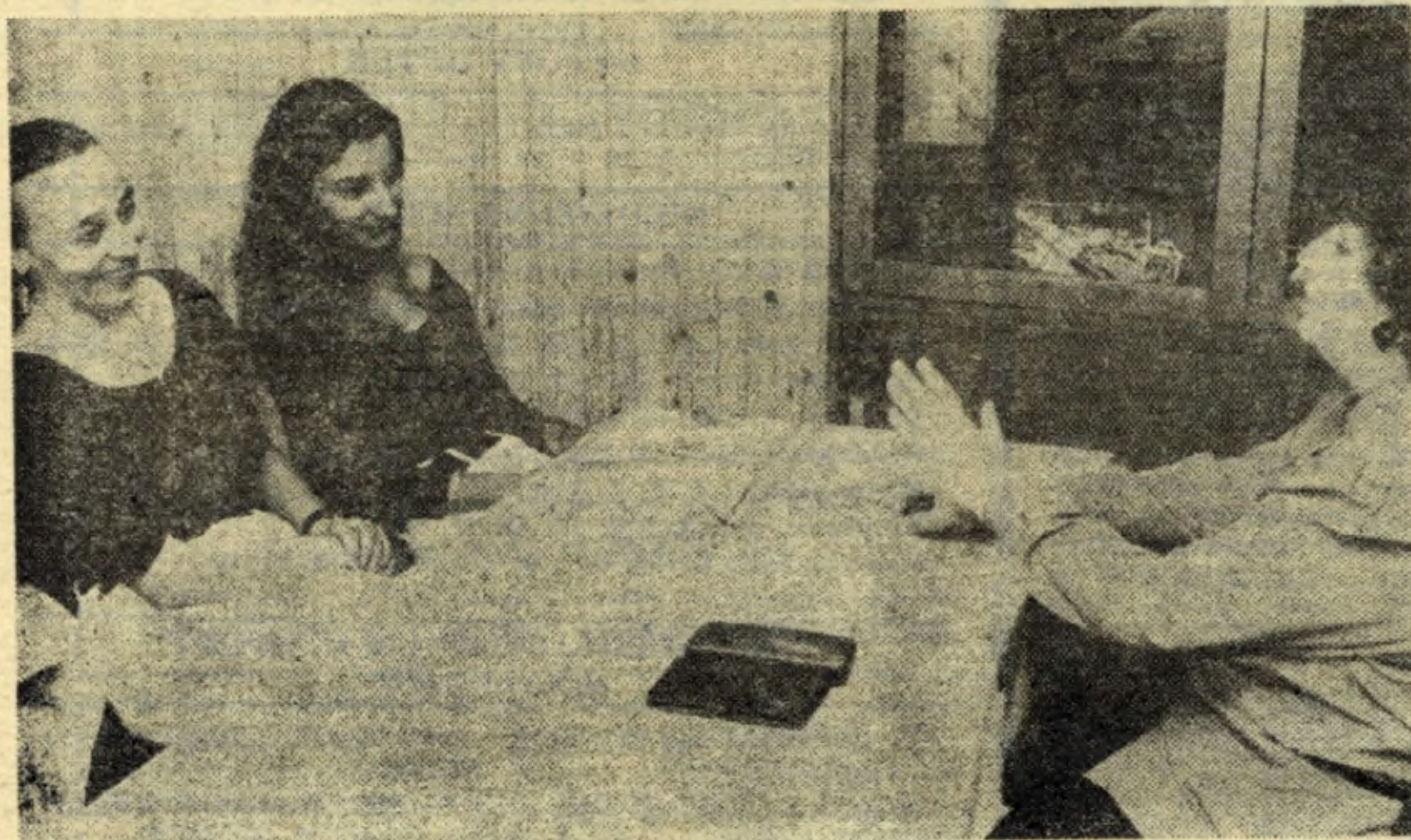
Czy mama z córką zrobią karierę w filmie?

(CIĄG DALSZY ZE STR. 1) Przepych przyrody jest wszechobecny w tym bitnie zielonym. Znaczna część leży w de- Mozy, a około 40 procent powierzchni poni-