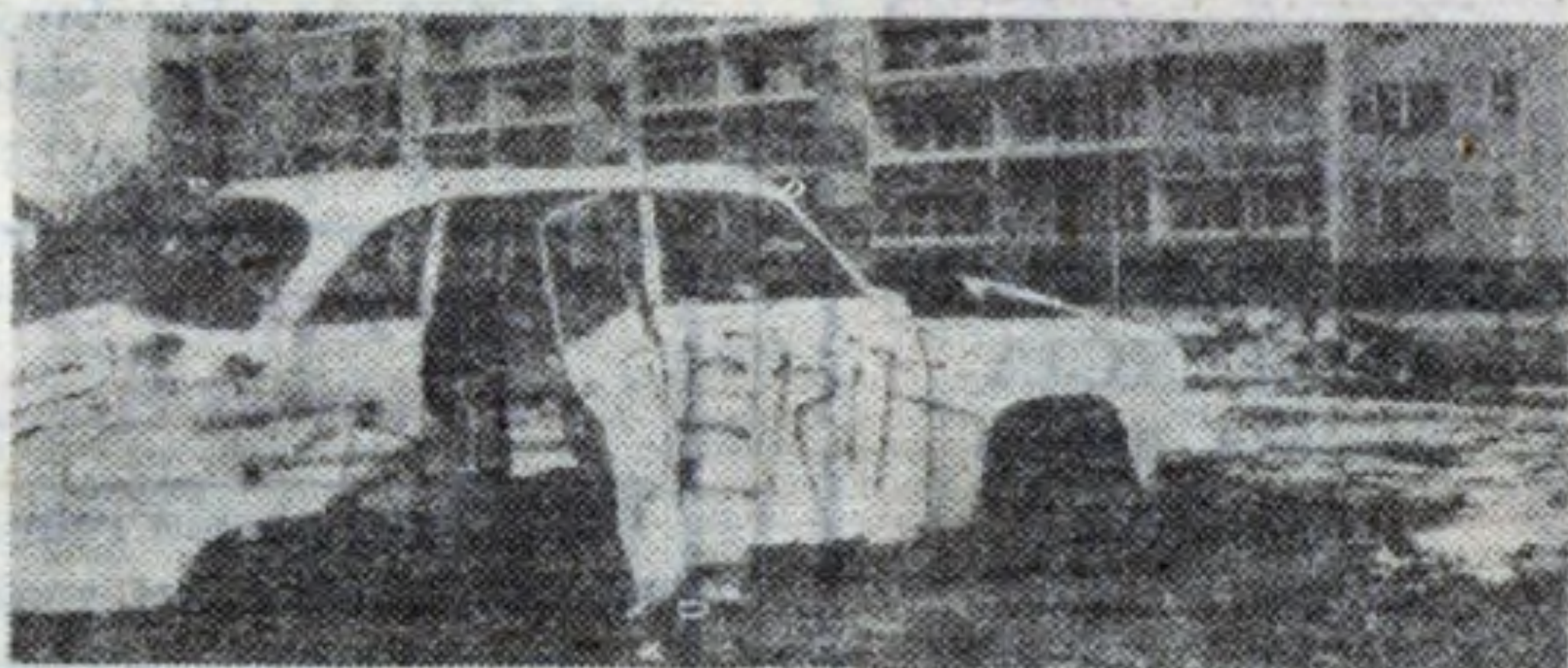
Ten wrak został już usunięty