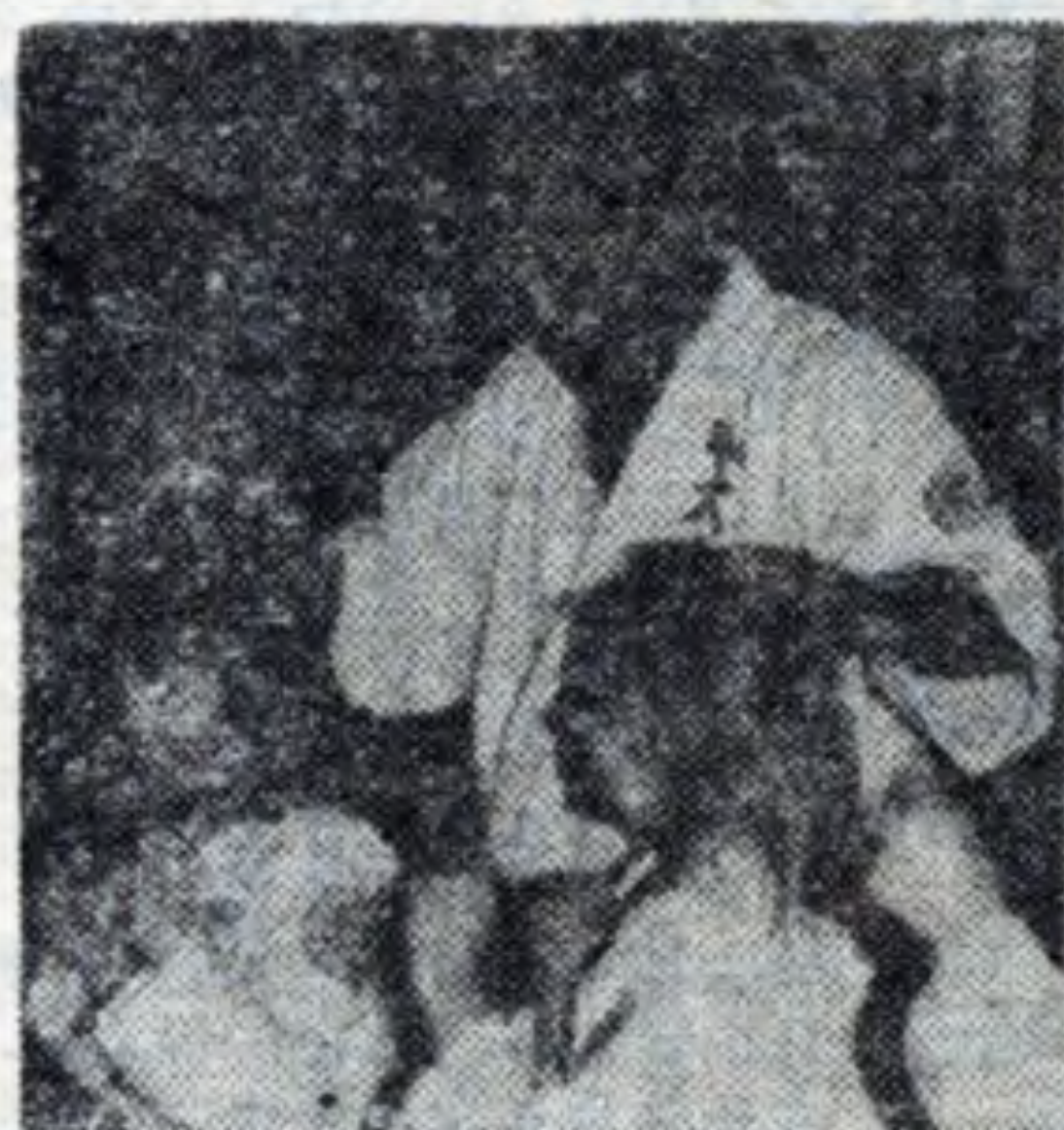
Twórca stylu Oyama Karate wśród dzieci w Nowej Hucie.