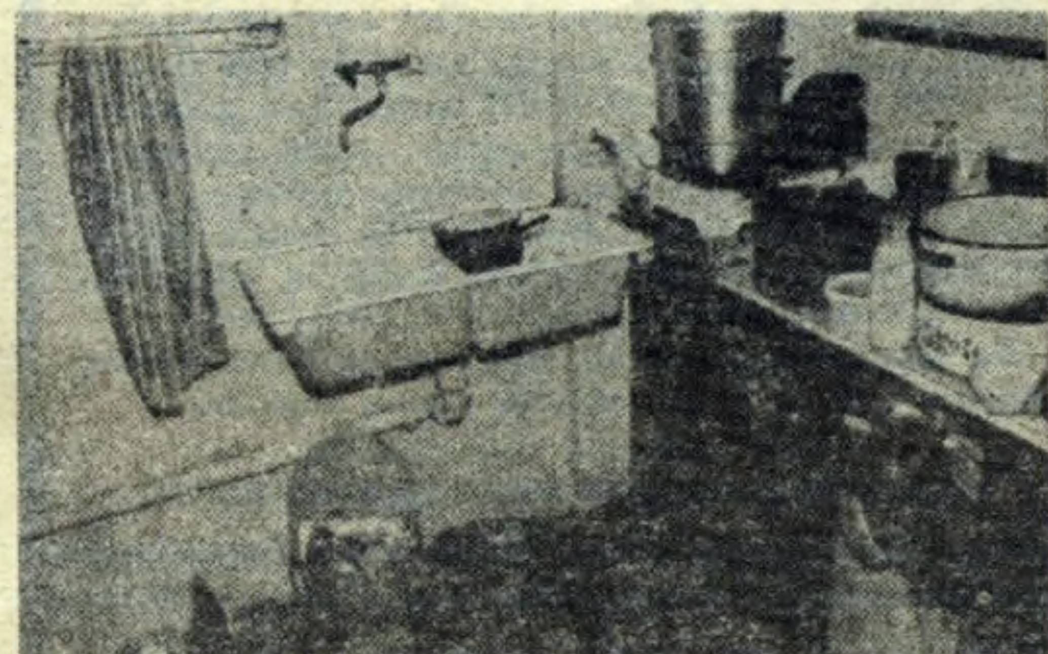
Wnętrze sklepu w os. Na Skarpie

W toalecie nie pamiętającej chyba szorowania, policjant znajduje „przystojnego” Janusza. Pijany, tam chciał przecze- kać nalo. Nie wyszło.