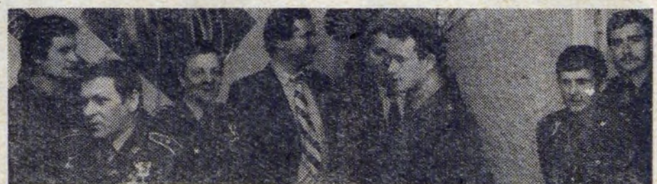
W ramach „Dni Leninowskich” w Klubie Młodych odbyło się spotkanie aktywu hutniczej organizacji młodzieżowej z przedstawicielami Wojskowego Okręgu Moskiewskiego Armii Radzieckiej, Grupy Północnej Wojsk Armii Radzieckiej, Warszawskiego Okręgu Wojskowego i jednostek wojskowych stacjonujących w Krakowie.