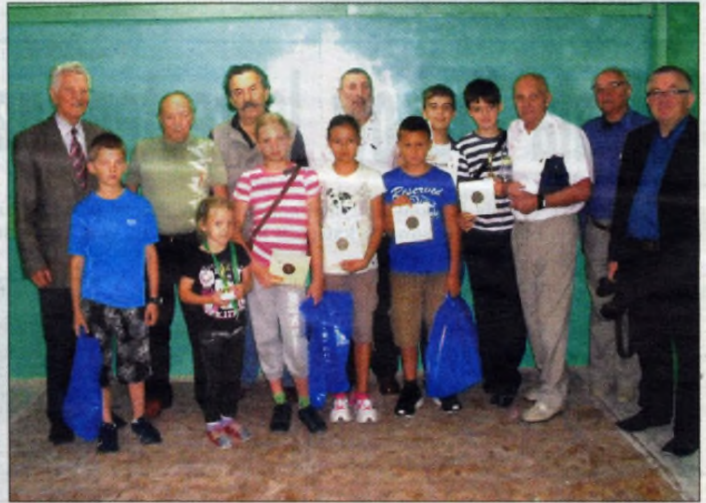
Najlepsi strzelcy z organizatorami akcji.

W ramach „Akcji Lato 2014”, 29 sierpnia br. przeprowadzone zostały zawody strzeleckie z karabinka pneumatycznego typu Iż-38 na Szkolnej Strzelnicy LOK w ZSO nr 14 w Nowej Hucie. Celem zawodów strzeleckich i „Dni Otwartej Strzelnicy” w czasie wakacji było podniesienie sprawności obronnych młodzieży szkolnej oraz popularyzacja strzelectwa sportowego, a także pożyteczne wykorzystanie czasu wolnego młodzieży w wakacje.