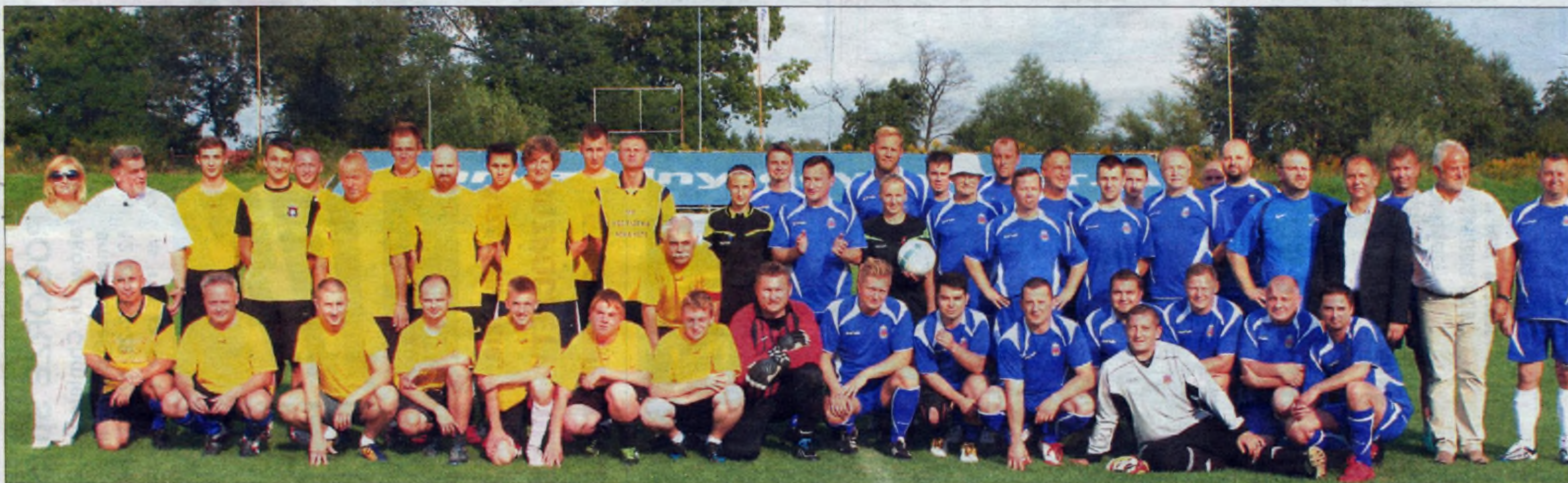
Pamiątkowe zdjęcie drużyn.