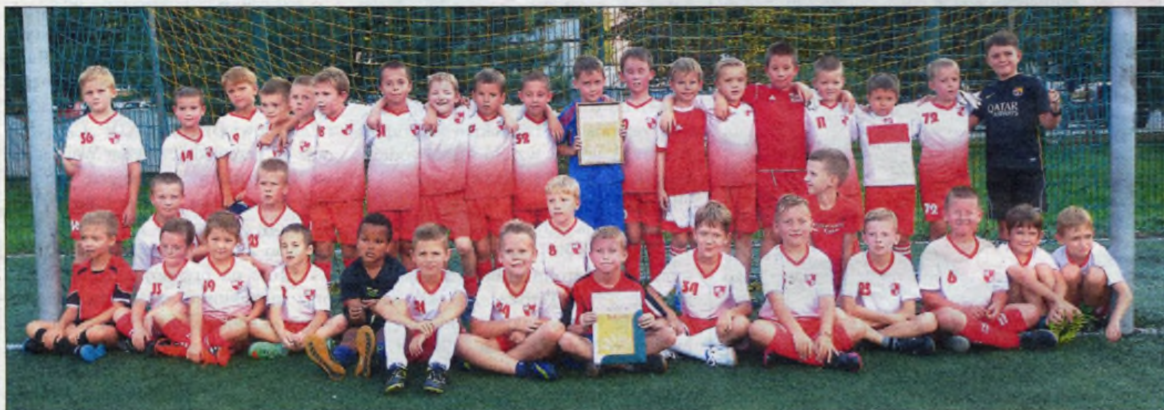
... i również dumni piłkarze.

Polonii gratulujemy! Sobie życzymy więcej takich inicjatyw w Nowej Hucie!