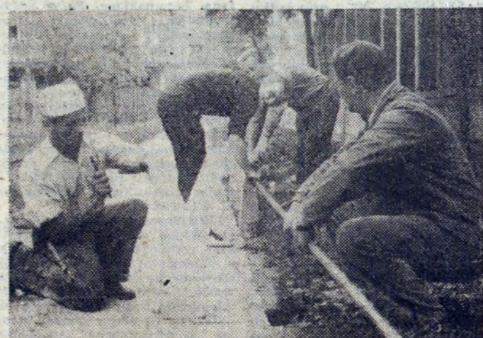
Mieszkańcy os. Ogrodowego nie od dziś znani są z wielu prac społecznych. Oto montaż ogrodzeń, których posiadanie mogą również inne osiedla Nowej Huty.