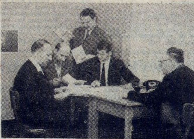
W punkcie konsultacyjnym dzielnicy — pracy nie brak.