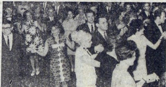
Bawimy się zbiorowo, proszę do kółeczka...