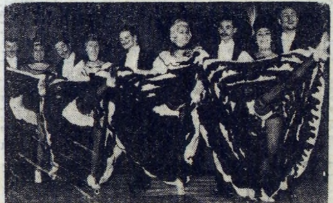
Na zdjęciu: ognisty kankan wykonaniu zespołu baletowego.

Przyzwyczajaliśmy się już do trochę innych programów cyrkowych. Ale trzeba przyznać, że innowacja, którą wprowadził występujący właśnie w Krakowie Cyrk Revue Variete, przyjęta jest przez publiczność bardzo życzliwie. Jest to bowiem wielka, międzynarodowa rewia tańca i mody na przestrzeni wieków, przeplatana numerami sztuki cyrkowej. Mniej stereotypowo, mniej tradycyjnie, zabawa jest jednak świetna.