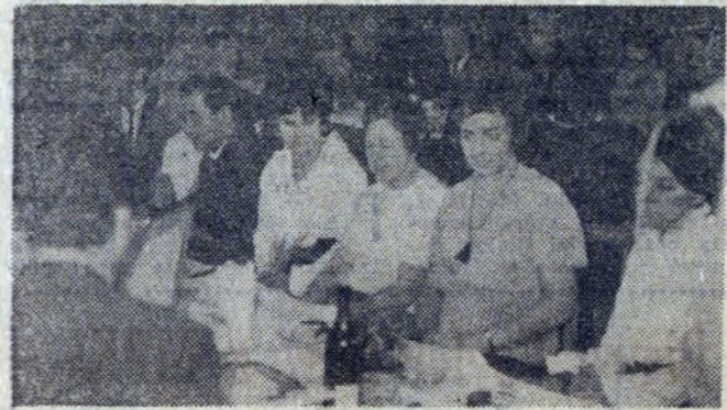
W Nowohuckim Przedsiębiorstwie Transportowym, odbyła się uroczysta KSR, a zarazem spotkanie z przedstawicielami podopiecznej Szkoły nr 37, w celu dalszego zacieśniania współpracy z gronem nauczycielskim.

Przez cały czas pobytu w Warszawie byliśmy goszczeni niezwykle serdecznie. Mieszkałmy w Hotelu Bristol. Program tych trzech dni był niezwykle urozmaicony. Wzięliśmy (Dokończenie na str. 4)