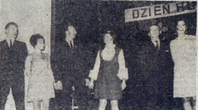
A oto zwycięskie pary konkursu tańca. Zdobyły nagrodę w postaci słodczy i butelki wina.