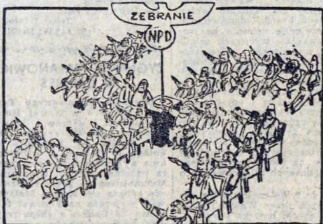
W siódmach starych metod...