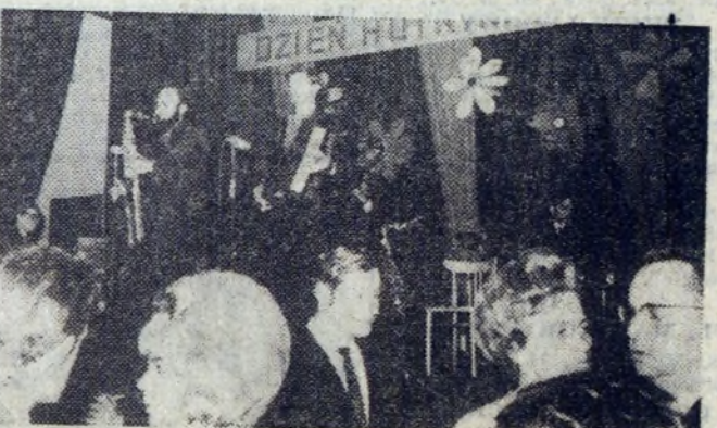
Orkiestra nie zawiodła: można było tańczyć non-stop.