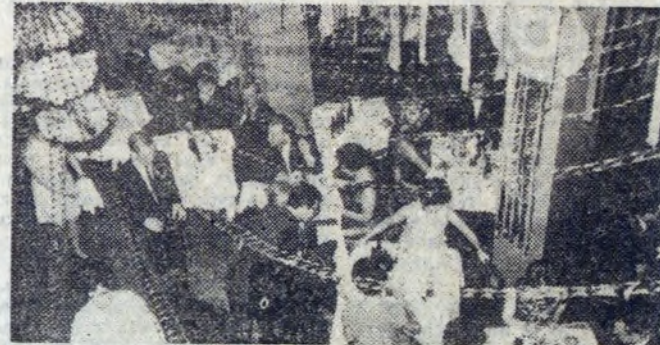
W takiej scenarii bal nie mógł się nie udać. Kolorowe kotyliony i girlandy wstążek prz ozdobiły całą salę.